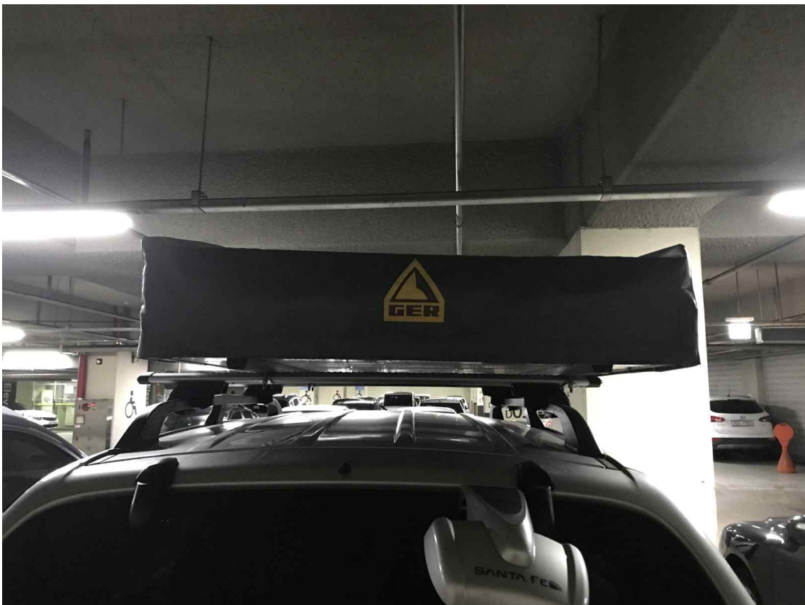
루프탑텐트가 한쪽으로 치우침(뒤에서 촬영)-텐트하부 지지철물이 가로바클립에 걸려 한쪽으로 치우치게 설치함