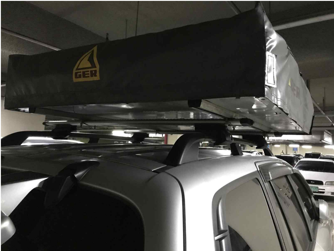
루프탑텐트가 한쪽으로 치우침(뒤에서 촬영)-텐트하부 지지철물이 가로바클립에 걸려 한쪽으로 치우치게 설치함